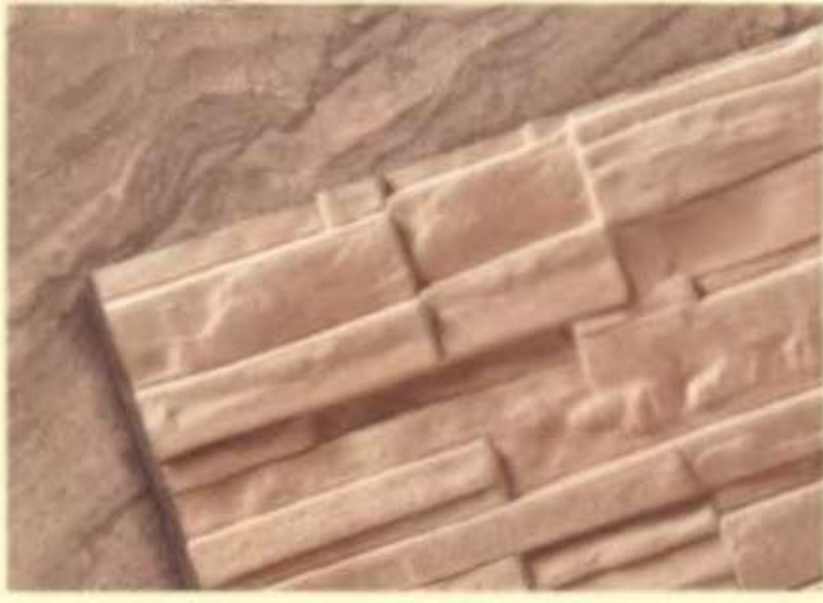
311 โรส ควอตซ์ (Rose Quartz)