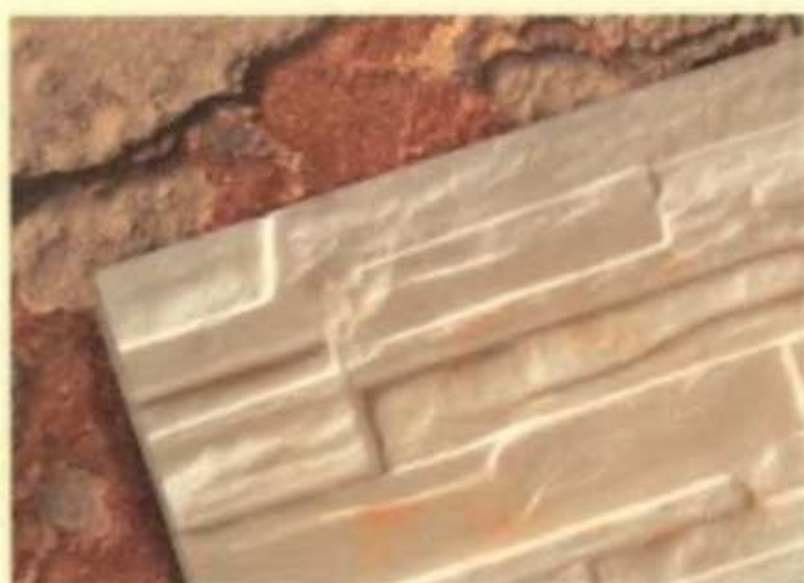
481 โครอล (Coral)