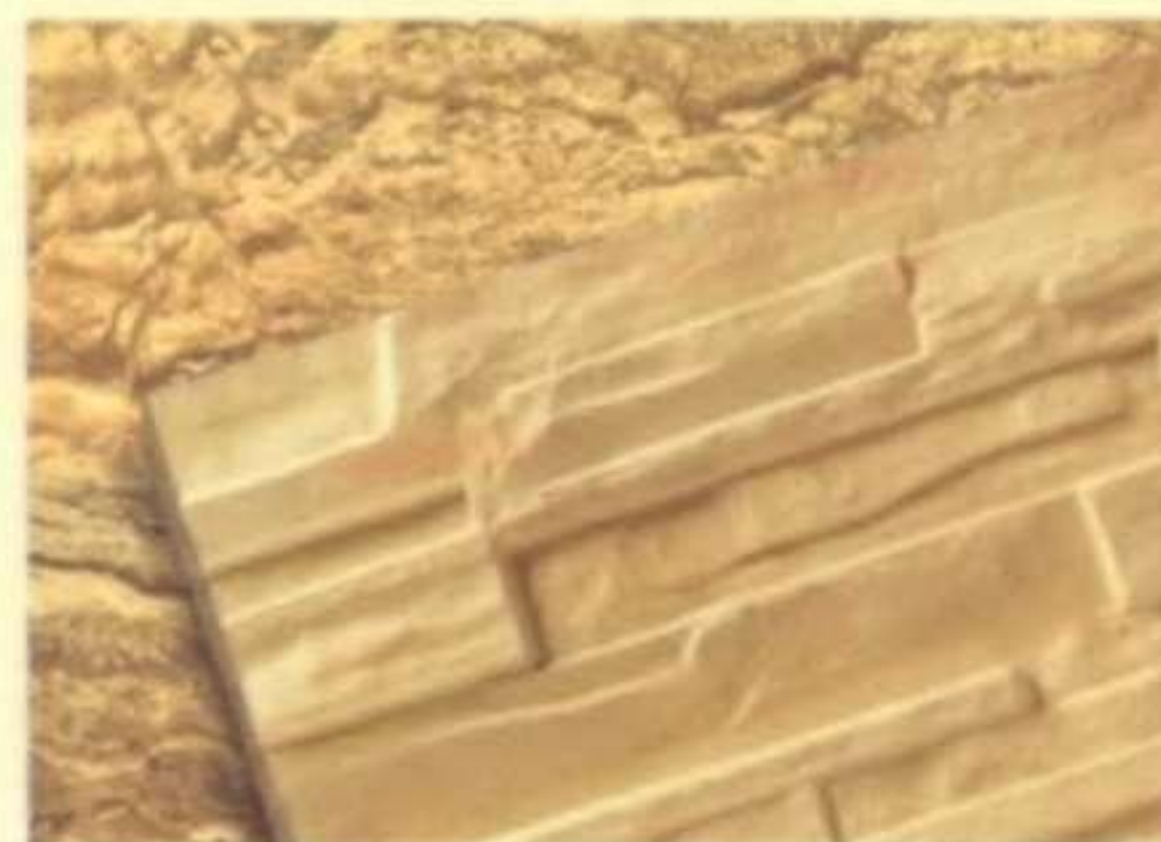
482 โกลด์ (Gold)