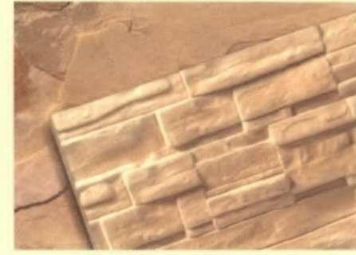
344 แคลไซต์ (Calcite)