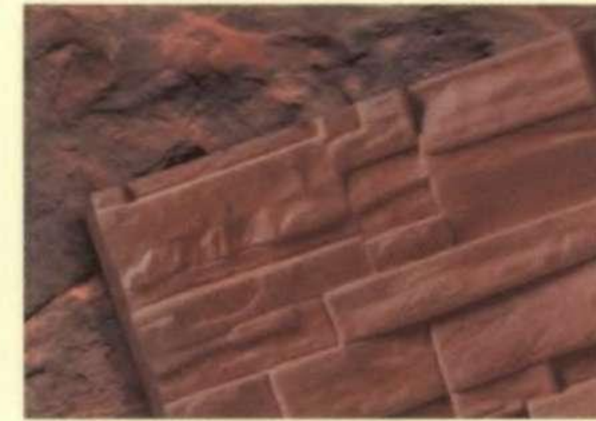
375 บรีค เพ็บบิล (Brick Pebble)