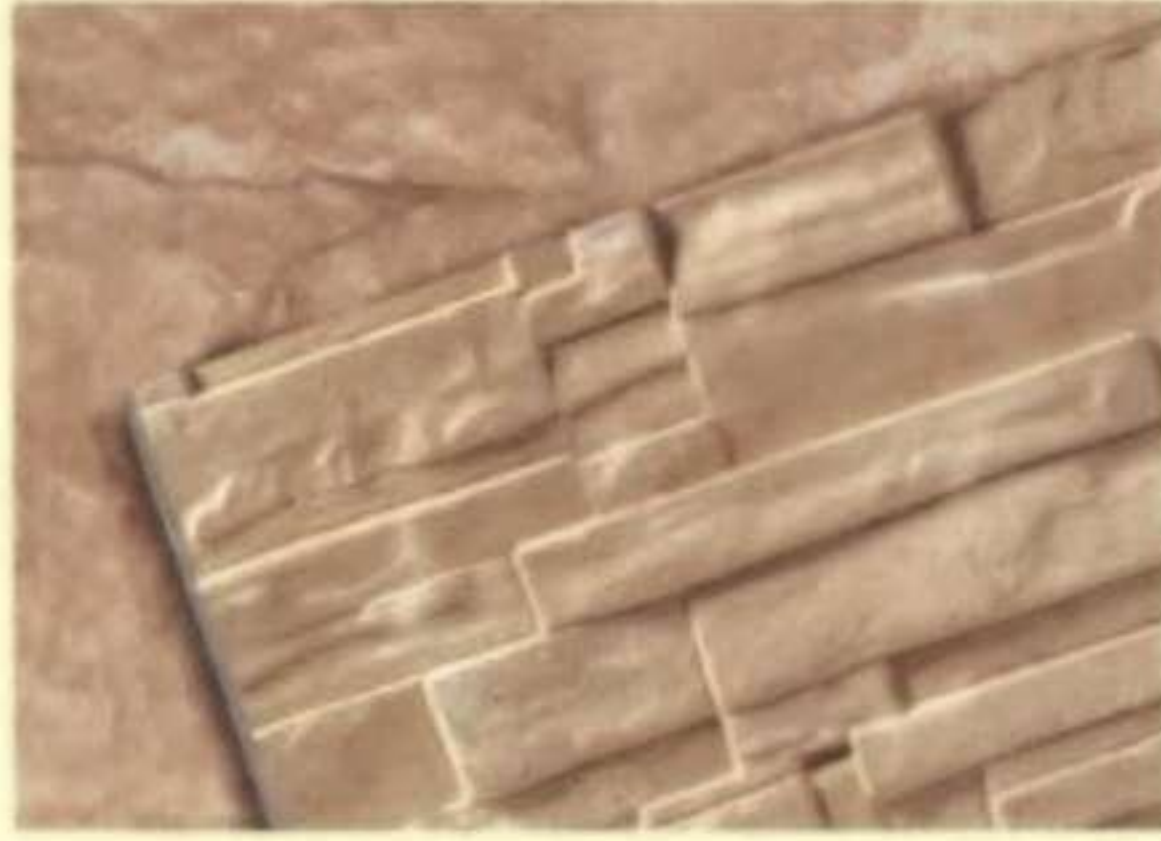
441 มิลค์กี้ โอพอล (Milky Opal)