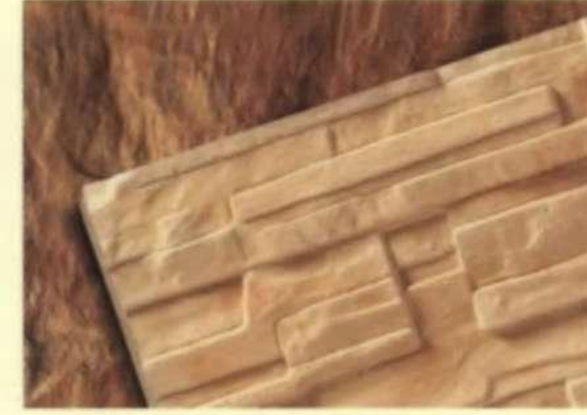
471 ซันสโตน (Sunstone)