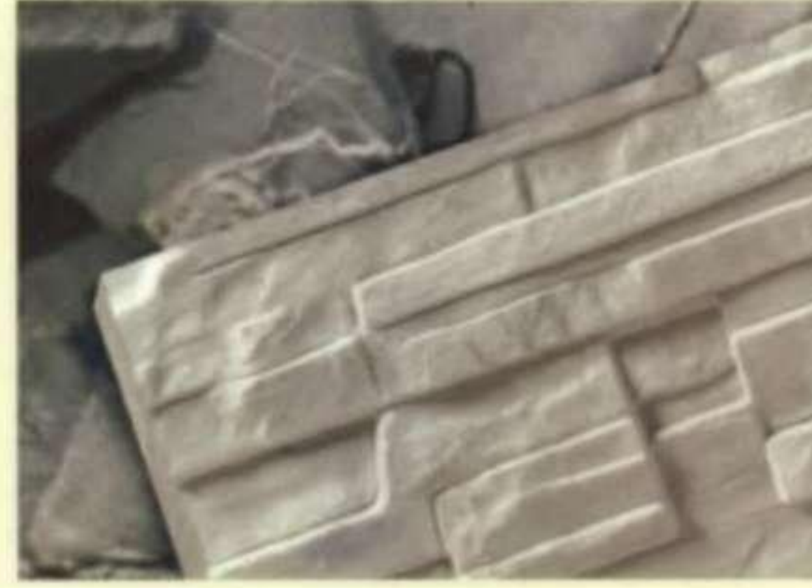
451 โฮวไลท์ (Howlite)