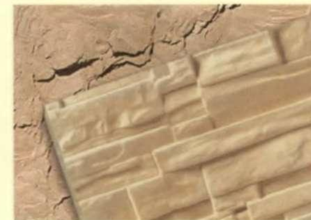
483 ซิทริน (Citrine)