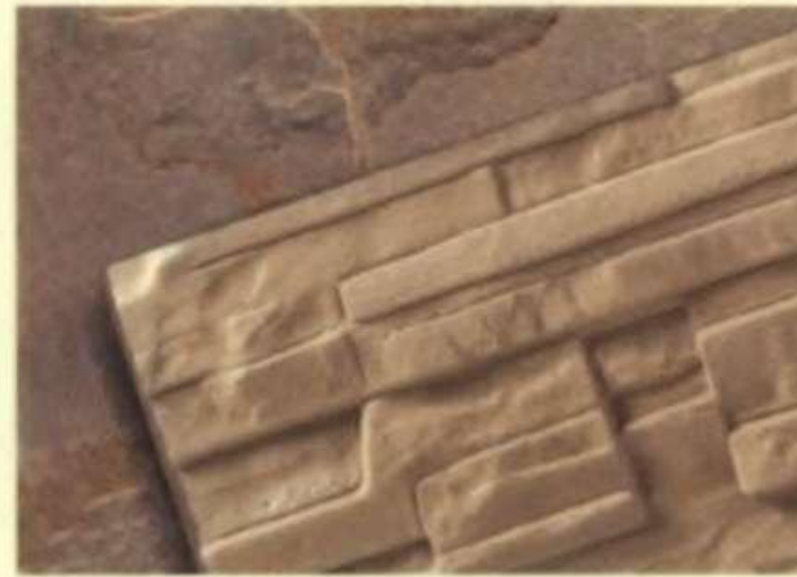
346 ฟอสซิล (Fossil)