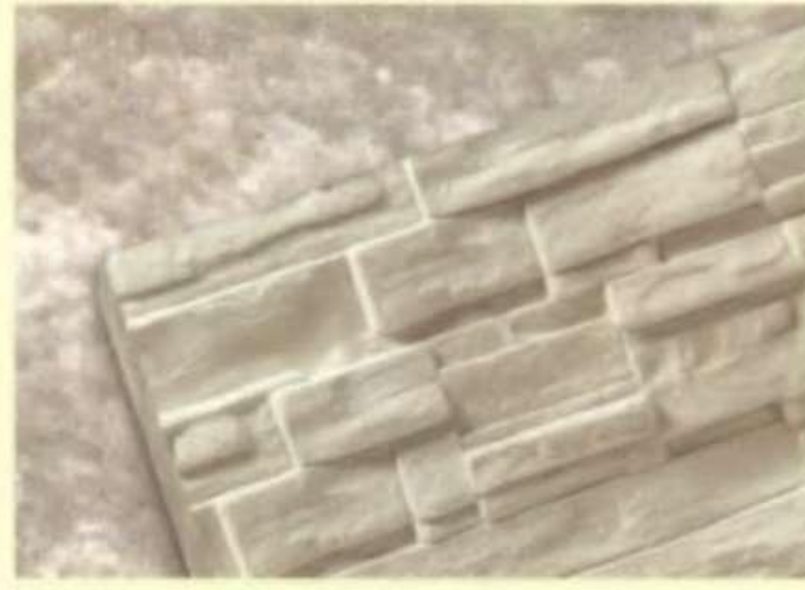
337 คริสตัล (Crystal)