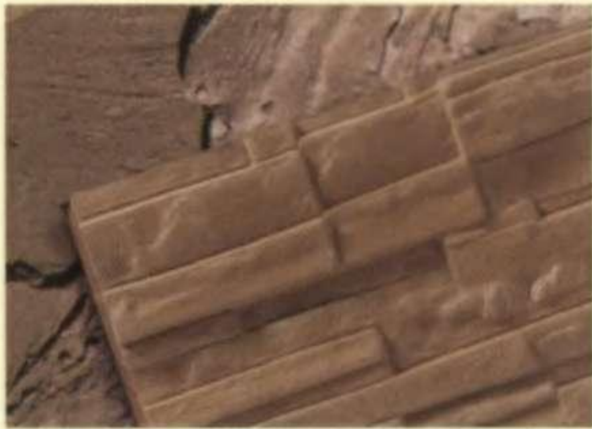
345 เคลสโตน (Claystone)